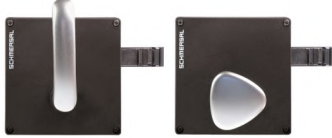
Kapı kolu seçenekleri